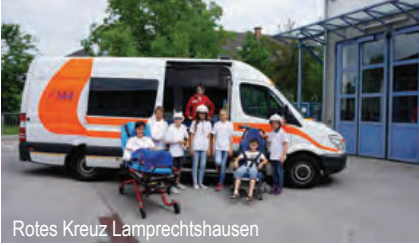
Rotes Kreuz Lamprechtshausen

Freitag, 14. August 09:00 – 12:00 Uhr Treffpunkt: Eingang Rotes Kreuz beim Gemeindeparkplatz